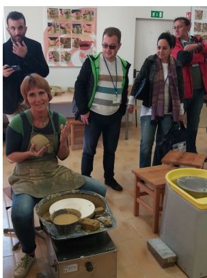
Spotkanie partnerów projektu YouInHerit w Słowenii