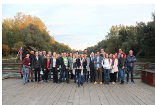
Spotkanie partnerów projektu YouInHerit w Słowenii