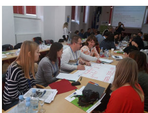
Spotkanie partnerów projektu YouInHerit w Słowenii