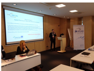
Spotkanie partnerów projektu NSB CoRe w Rydze