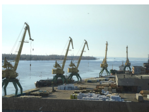
Spotkanie partnerów projektu NSB CoRe w Rydze