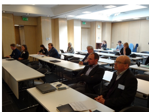
Spotkanie partnerów projektu NSB CoRe w Rydze