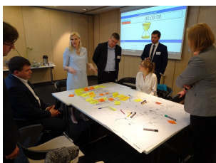
Spotkanie partnerów projektu NSB CoRe w Rydze