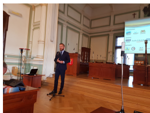
Rok rzeki Wisły 2017 - drogi wodne w węzłach miejskich CNC w Polsce- wyzwania i szanse