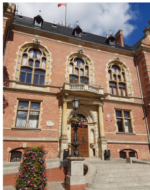
Rok rzeki Wisły 2017 - drogi wodne w węzłach miejskich CNC w Polsce- wyzwania i szanse