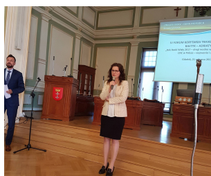
Rok rzeki Wisły 2017 - drogi wodne w węzłach miejskich CNC w Polsce- wyzwania i szanse