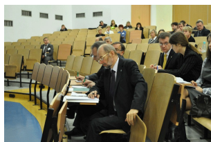
Konferencja w Radomiu