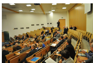
Konferencja w Radomiu