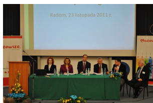
Konferencja w Radomiu