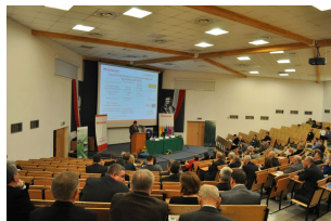
Konferencja w Radomiu