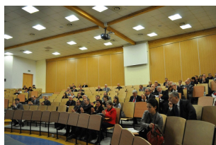
Konferencja w Radomiu