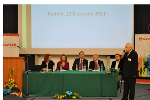
Konferencja w Radomiu