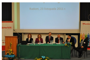
Konferencja w Radomiu