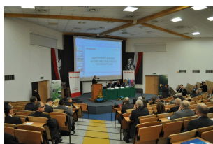
Konferencja w Radomiu