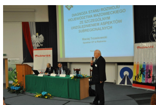
Konferencja w Radomiu