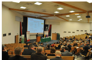
Konferencja w Radomiu