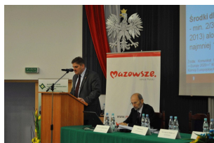
Konferencja w Radomiu