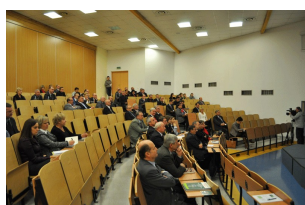
Konferencja w Radomiu Galeria z Konferencji w Radomiu