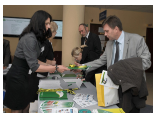
Konferencja w Płocku