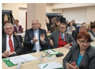
Konferencja w Płocku