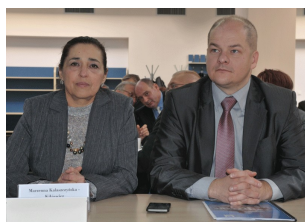
Konferencja w Płocku