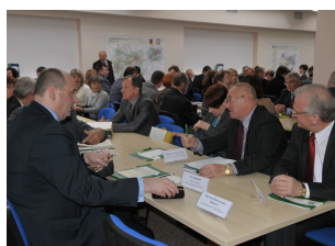
Konferencja w Płocku