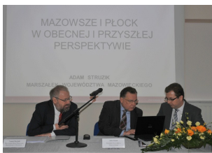
Konferencja w Płocku