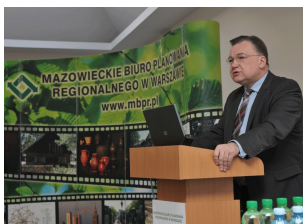
Konferencja w Płocku

Media o Konferencji: W 45 minut do Warszawy? - czasplocka.pl