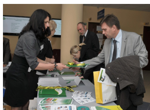
Konferencja w Płocku