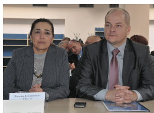
Konferencja w Płocku