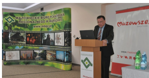
Konferencja w Płocku