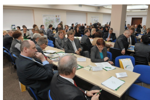
Konferencja w Płocku