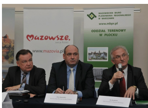
Konferencja w Płocku