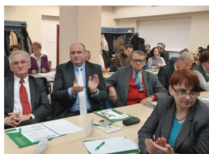
Konferencja w Płocku