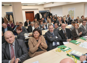
Konferencja w Płocku