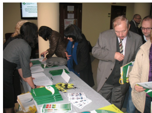
Konferencja w Płocku Galeria z Konferencji w Płocku