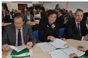
Konferencja w Płocku