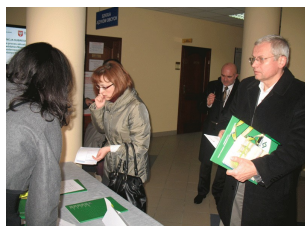
Konferencja w Płocku