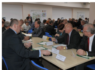
Konferencja w Płocku