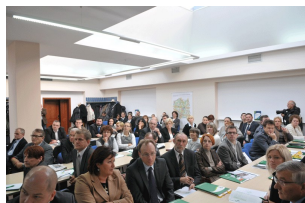
Konferencja w Płocku