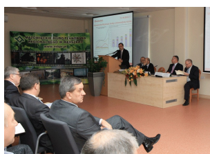
Konferencja w Ostrołęce