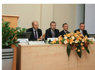
Konferencja w Ostrołęce