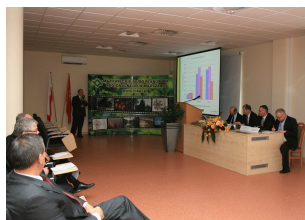
Konferencja w Ostrołęce