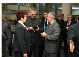
Konferencja w Ostrołęce