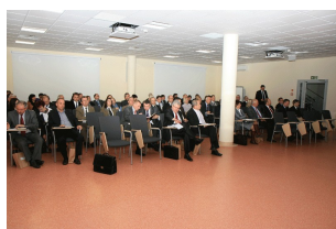
Konferencja w Ostrołęce