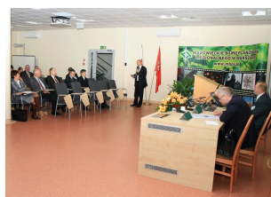
Konferencja w Ostrołęce