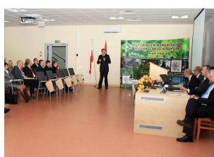
Konferencja w Ostrołęce