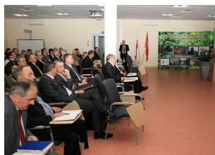
Konferencja w Ostrołęce