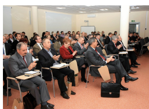
Konferencja w Ostrołęce