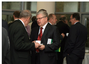
Konferencja w Ostrołęce