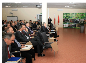
Konferencja w Ostrołęce