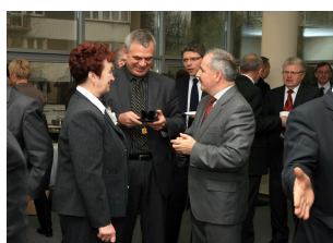
Konferencja w Ostrołęce