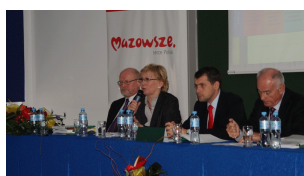
Konferencja w Ciechanowie