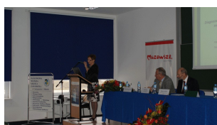
Konferencja w Ciechanowie