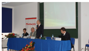
Konferencja w Ciechanowie