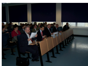
Konferencja w Ciechanowie