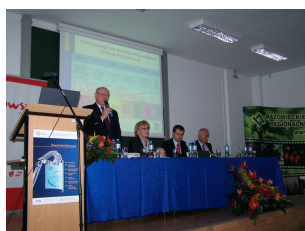
Konferencja w Ciechanowie