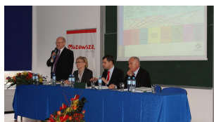
Konferencja w Ciechanowie