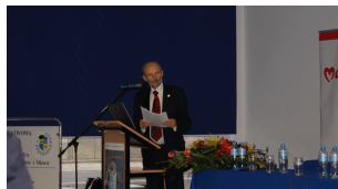
Konferencja w Ciechanowie