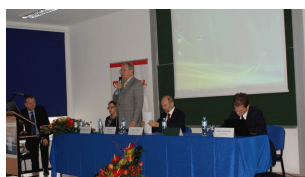
Konferencja w Ciechanowie