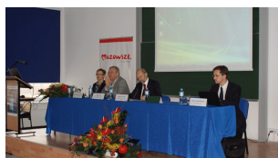
Konferencja w Ciechanowie