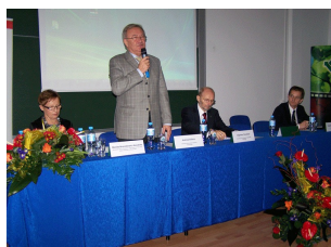
Konferencja w Ciechanowie