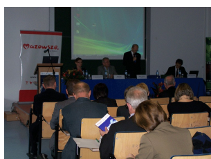
Konferencja w Ciechanowie