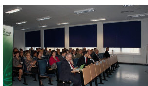
Konferencja w Ciechanowie