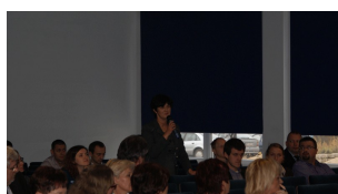
Konferencja w Ciechanowie