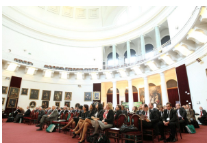
II forum Mazowieckie