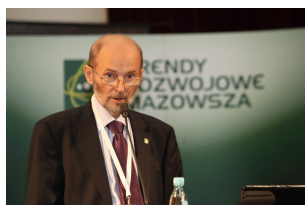
II forum Mazowieckie

Opinie przedstawione podczas konferencji otwierającej proces aktualizacji dokumentów strategicznych oraz podczas konferencji subregionalnych odbywających się w listopadzie i grudniu w miastach subregionalnych Mazowsza, będą rozważane i uwzględniane w nowych celach rozwoju województwa mazowieckiego.