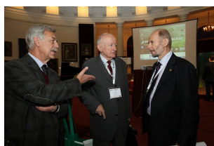
II forum Mazowieckie