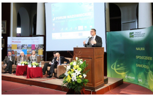
II forum Mazowieckie