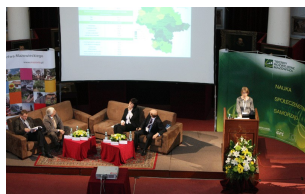
II forum Mazowieckie