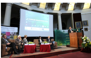
II forum Mazowieckie