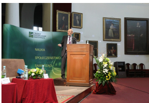
II forum Mazowieckie