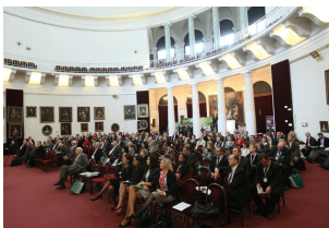
II forum Mazowieckie