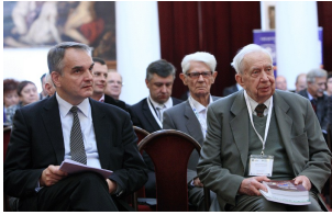
II forum Mazowieckie