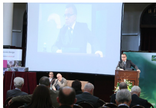
II forum Mazowieckie