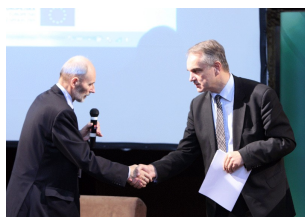
II forum Mazowieckie