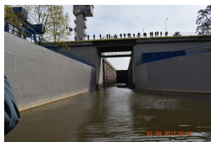
Rejs kontenerowy po Wiśle w ramach projektu EMMA