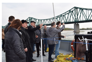
Rejs kontenerowy po Wiśle w ramach projektu EMMA