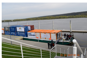
Rejs kontenerowy po Wiśle w ramach projektu EMMA

Celem rejsu było pokazanie możliwości śródlądowego transportu wodnego, promocja żeglugi śródlądowej, jako proekologicznego środka transportu, upowszechnienie wiedzy o potencjale gospodarczym rzek, a także identyfikacja utrudnień żeglugowych i przeprowadzenie badań szlaku wodnego. Na barce zaprezentowano koncepcję rozwoju i zagospodarowania przestrzennego terenów wokół Zbiornika Włocławskiego oraz poprawę stanu technicznego i bezpieczeństwa powodziowego stopnia wodnego Włocławek. Ważnym elementem spotkania były robocze rozmowy na temat różnych aspektów żeglugi na Wiśle oraz współpracy w gospodarczym wykorzystaniu Zbiornika Włocławskiego i rzeki Wisły.