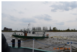
Rejs kontenerowy po Wiśle w ramach projektu EMMA