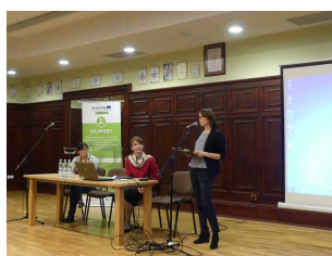
Plan Działań i Działanie Pilotażowe w projekcie YouInHerit tematem III spotkania Regionalnej Grupy Interesariuszy 24 października w Sierpcu

Więcej informacji o projekcie YouInHerit dostępnych jest na stronie internetowej Interreg oraz na portalu Facebook projektu .