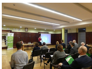
Plan Działań i Działanie Pilotażowe w projekcie YouInHerit tematem III spotkania Regionalnej Grupy Interesariuszy 24 października w Sierpcu