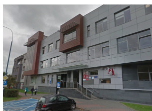
Oddział Terenowy MBPR w Ostrołęce

OTO posiada doświadczenie i bogaty dorobek w zakresie planowania i zagospodarowania przestrzennego. Stanowi to podstawę współpracy i dzielenia się dobrymi praktykami z pozostałymi jednostkami MBPR. Ważnym atutem Oddziału w Ostrołęce jest doświadczenie w realizacji projektów współfinansowanych z funduszy unijnych.