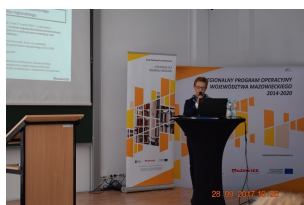
Od pomysłu do realizacji - konferencja subregionalna w Ciechanowie

Konferencja stała się miejscem wymiany informacji i doświadczeń pomiędzy samorządami, przedsiębiorcami, a także potencjalnymi odbiorcami funduszy europejskich.