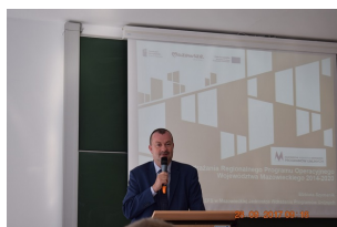
Od pomysłu do realizacji - konferencja subregionalna w Ciechanowie