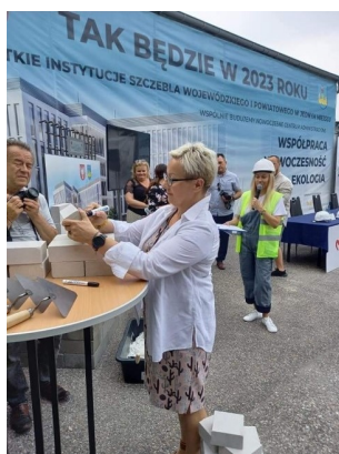
Nowe Centrum Administracyjne w Ciechanowie – budowa Galeria z budowy nowego Centrum Administracyjnego w Ciechanowie