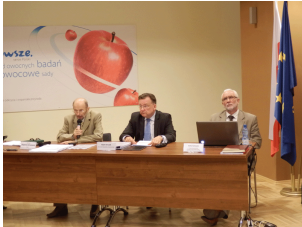
Konferencja w Warszawie