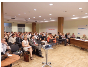
Konferencja w Warszawie Galeria z Konferencji w Warszawie