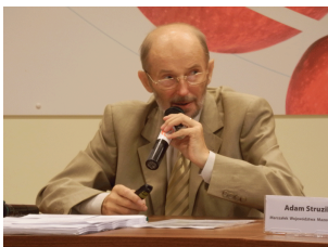
Konferencja w Warszawie