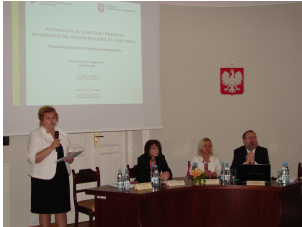
Konferencja w Siedlcach