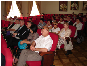
Konferencja w Siedlcach