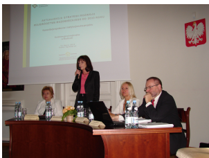
Konferencja w Siedlcach Galeria z Konferencji w Siedlcach