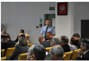
Konferencja w Radomiu Galeria z Konferencji w Radomiu