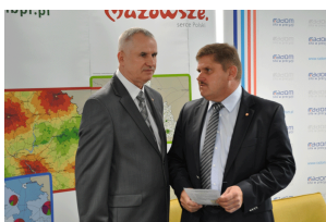
Konferencja w Radomiu