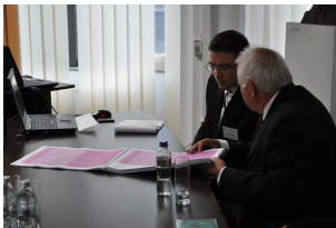
Konferencja w Radomiu