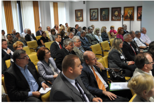
Konferencja w Radomiu