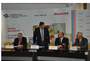
Konferencja w Radomiu