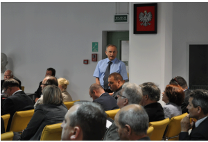
Konferencja w Radomiu Galeria z Konferencji w Radomiu