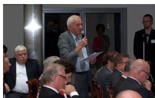
Konferencja w Płocku