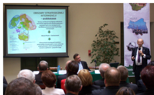
Konferencja w Płocku