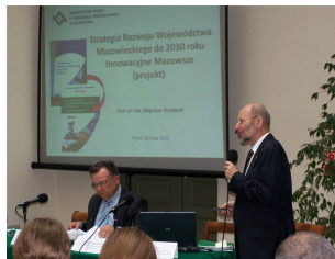
Konferencja w Płocku Galeria Konferencji w Płocku