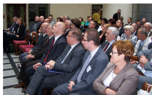
Konferencja w Płocku