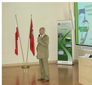
Konferencja w Ostrołęce