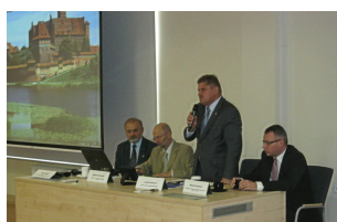
Konferencja w Ostrołęce

Media o konferencji: Planiści o rozwoju subregionu ostrołęckiego