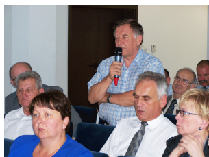
Konferencja w Ciechanowie