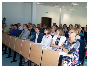
Konferencja w Ciechanowie