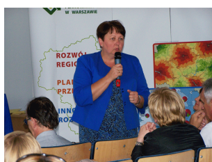
Konferencja w Ciechanowie