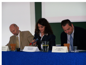
Konferencja w Ciechanowie