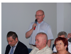
Konferencja w Ciechanowie