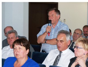
Konferencja w Ciechanowie